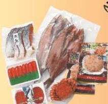
北海道:道産丸詰合わせ