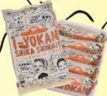
愛媛:い〜よかんしかしない