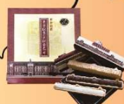
東京:東京駅丸の内駅舎最中