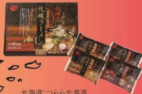
北海道:つらら北海道札幌ラーメン