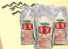
大阪:蓬莱本館まんセット