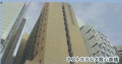
ネストホテル大阪心斎橋