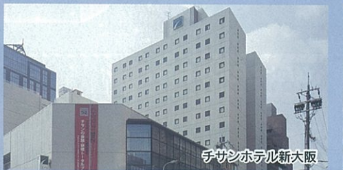
チサンホテル新大阪